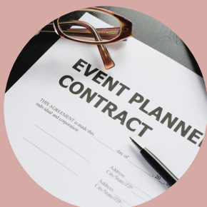
Contractualisation Signature et paiement