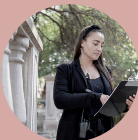
Mise en place opérationnelle création du roadbook