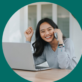
Prise de brief Mail, téléphone, rdv