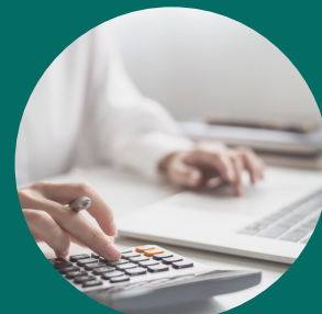
Création de l'événement budgétisé et illustré